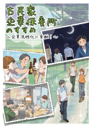
古民家企業保養所のすすめ ～企業活性化に貢献！～