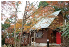
一戸建て 天然温泉がある仄々LDKのログハウス風住宅