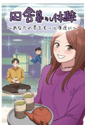
田舎暮らし体験 ～あなたの夢をもっと身近に～