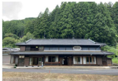
古民家 田舎暮らしを満喫できる生活環境にも恵まれた古民家住宅