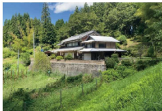
一戸建て 田舎暮らしにお勧め！純日本家屋